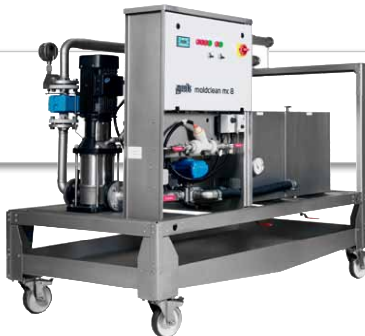
gwk moldclean mc 8: La solution innovatrice pour le nettoyage simultané de jusqu'à 8 circuits de thermo-régulation.

Augmenter la productivité grâce à la protection et le nettoyage des canaux de refroidissement.