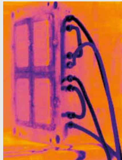
Répartition homogène de la température dans l'outillage après nettoyage des circuits de refroidissement.