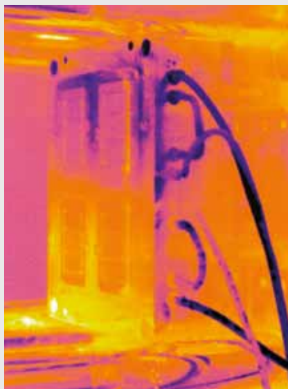
Répartition non uniforme de température dans un outillage en raison de l'encrassement des circuits de refroidissement.

Ceci correspondait à 48.000 EUR. Les coûts de nettoyage sont amortis en quelques jours.