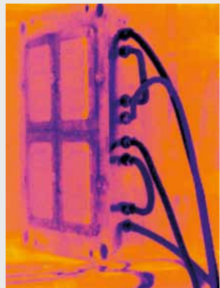
Répartition homogène de la température dans l'outillage après nettoyage des circuits de refroidissement.