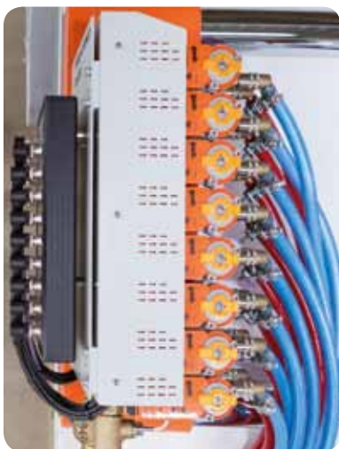
Regelversion mit automatischer Durchflussmengenregelung

Es vereint die Vorteile der bislang üblichen Wasserverteiler, der Impulskühlsysteme und der kontinuierlich arbeitenden Temperiergeräte und eliminiert die Nachteile der jeweiligen Systeme.