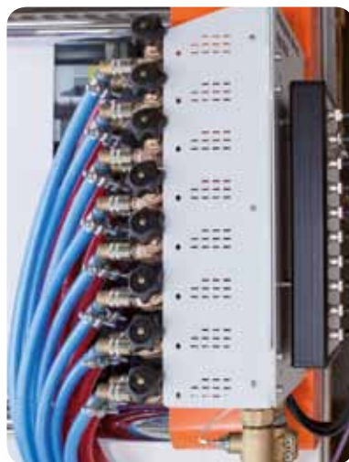
Basisversion mit manueller Durchflussmengeneinstellung